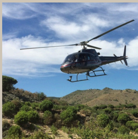
Volant en helicòpter Sortida des de Montmeló