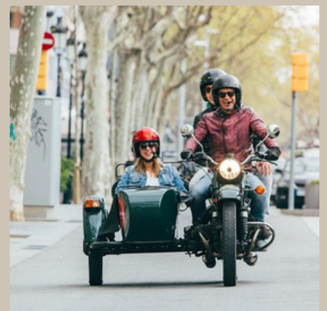
En Sidecar des de Barcelona Col·laboració amb Bright Side Tours