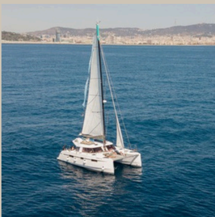
Navegant des de Barcelona Proveïdors variats segons disponibilitat